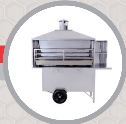
Carrinho de Churrasco – cód.: 79880