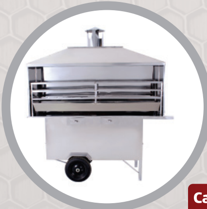
Carrinho de Churrasco – cód.: 66856