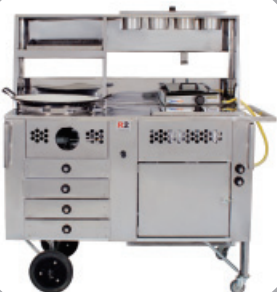
Carrinho 3 em 1 – cód.: 67062