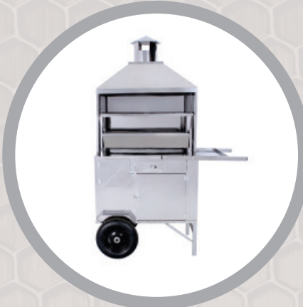
Carrinho de Churrasco – cód.: 67159