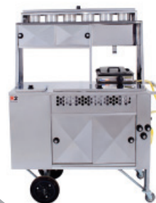
Carrinho 2 em 1 – cód.: 11407

Batata, Cachorro-quente, Churrasco, Lanche e Pastel.