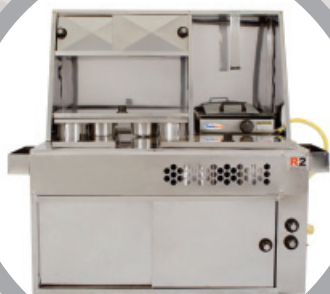
Kit 2 em 1 – cód.: R0088

Cachorro-quente e Lanche | Towner e Fiorino.