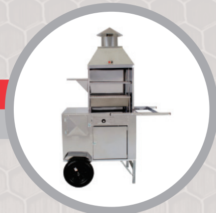
Carrinho de Churrasco – cód.: 67200