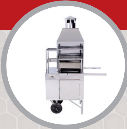
Carrinho de Churrasco cód.: 67069 (inox) | 67069G (galvanizado)