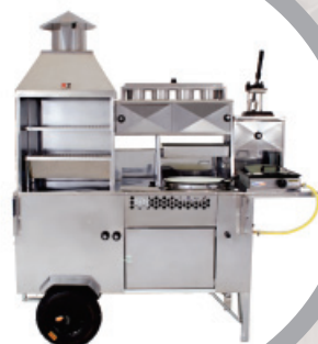
Carrinho 5 em 1 – cód.: 1715

Batata, Cachorro-quente, Churrasco e Pastel.