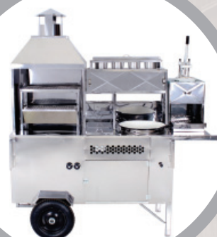
Carrinho 4 em 1 – cód.: 66853

Batata, Cachorro-quente, Churrasco e Pastel.